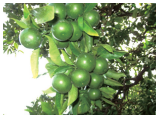
果皮の粗い上向きは美味しくない 内・裾成りの小玉果は摘果する