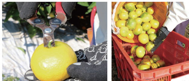
ヘタを傷つけないように軸を切り落とす 果実をコンテナに移すときは低い位置から

また、浮き皮果発生が懸念される場合は、カルシウム剤やグリーンシステムを数回散布して発生軽減に努めましょう。