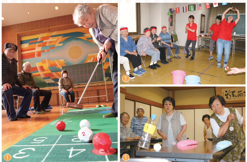
① ミニデイサービス ② 認知症研修