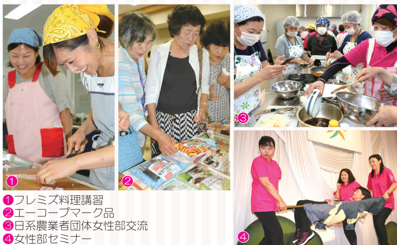
① フレミズ料理講習 ② エーコープマーク品 ③ 日系農業者団体女性部交流 ④ 女性部セミナー

JAにしうわの協力組織は令和元年度の総会を開き「次世代に豊かな暮らしを」「明るい未来のために」「安心できる暮らしを」それぞれの目標に向かって新たなスタートを切りました。今後の活動・活躍に注目していきましょう。