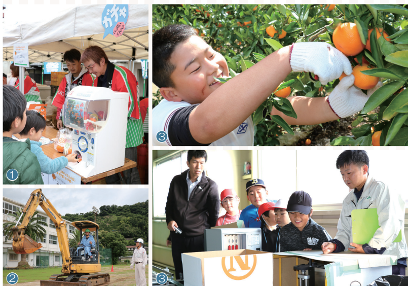
① 伊予柑イベント ② ユンボ講習会 ③ 食農教育