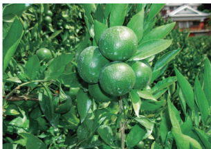
果皮の粗い上向きの 大玉果は美味しくない

温州みかん・中晩柑の粗摘果が終えられていない方は、早急に粗摘果を終わらせるようにしてください。仕上げ摘果は、着果ストレスがかかり始め果実表面のキメが良くなる8月下旬頃から開始しましょう。軸太・上向きの果皮粗果は、10月中旬頃から樹上選果で摘果し秋芽を発生させないように注意しましょう。