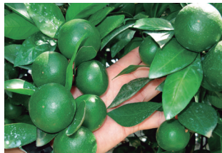
内・裾成りの 小玉果は摘果