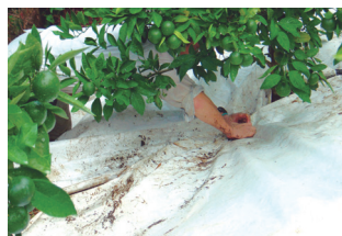
被覆率を高めて効果を確実に 樹幹下・全面・開閉マルチ

近年、秋季の高温多雨による品質の低下が課題となっており、自分の園地状況と作業の段取りに合わせて積極的に被覆を行いましょ