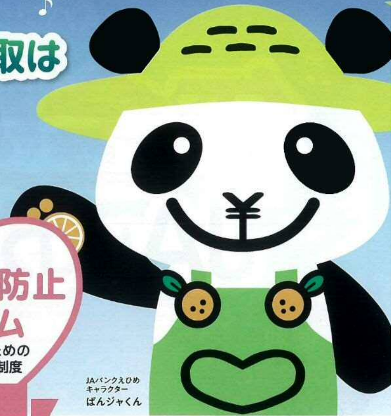
JAバンクえひめ キャラクター ばんじゃくん