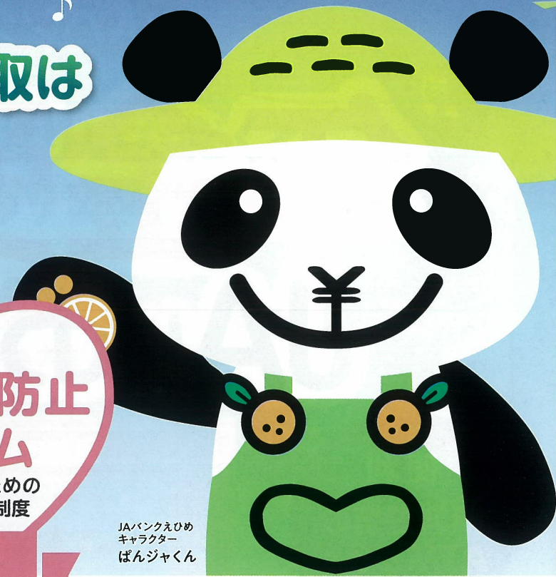
JAバンクえひめ キャラクター ばんじゃくん