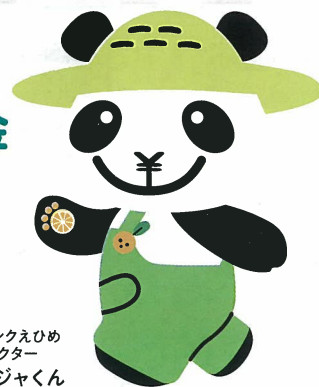
JAバンクえひめ キャラクター ばんじゃくん